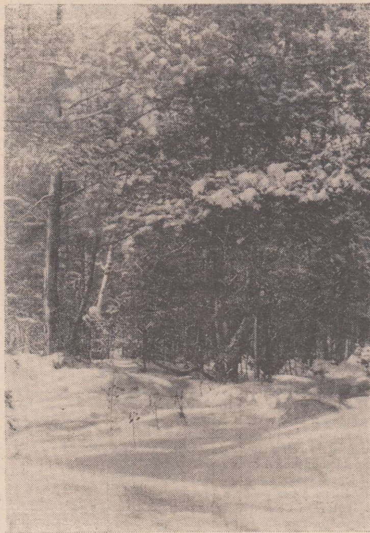
ЗИМА В ЛЕСУ